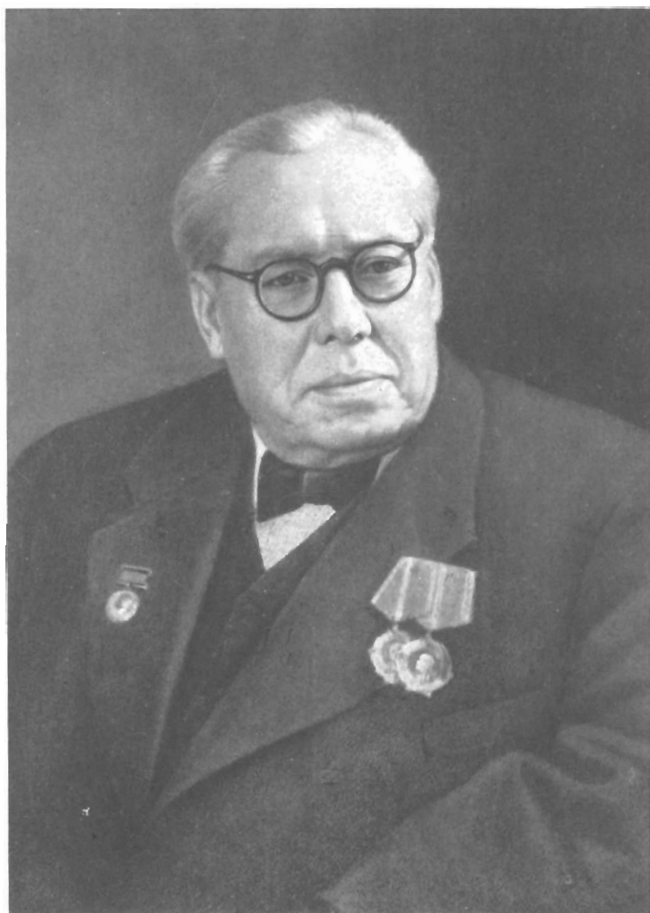
Академик НИКОЛАЙ СЕВАСТ'ЯНОВИЧ ДЕРЖАВИН (1877—1953)